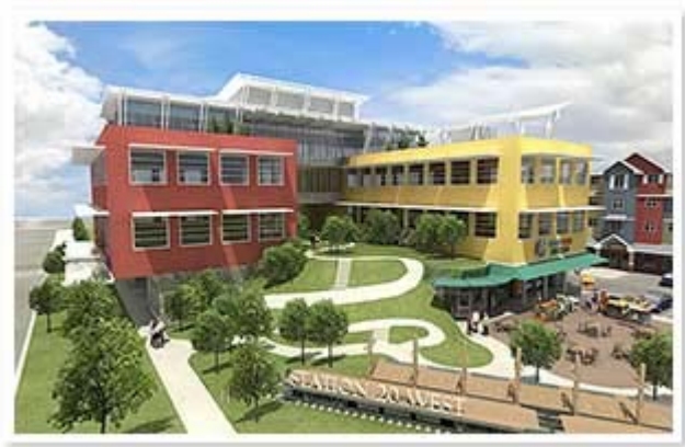
Station 20 West